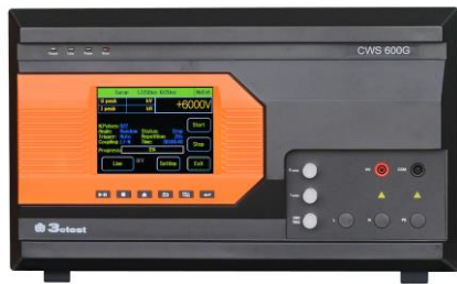
CWS 600/600T/600CT 组合波雷击浪涌模拟器