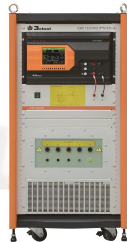
CWS 600G/SPN 69100T 大功率雷击浪涌测试系统