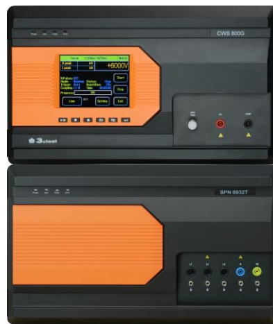
CWS 800 组合波雷击浪涌模拟器